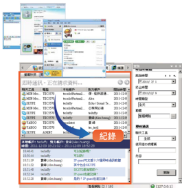
完整記錄即時通訊文字對話內容、起訖時間、使用者ID / 暱稱.....等訊息。