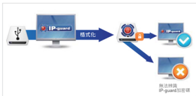
可將任何移動儲存裝置格式化成IP-guard加密碟。